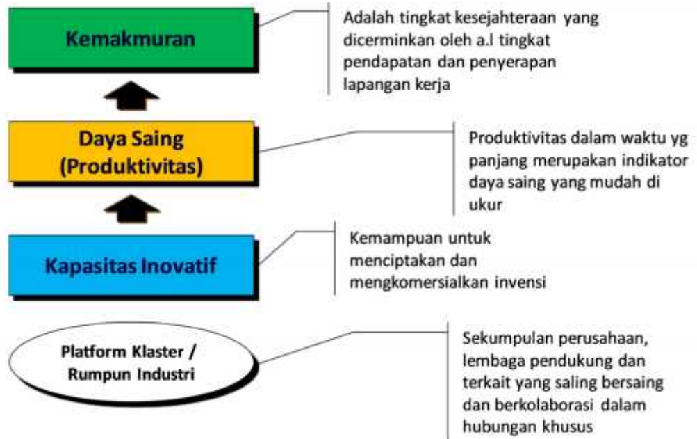
Gambar: Kapasitas Inovatif sebagai jalan untuk mencapai kemakmuran

Sebagai bagian dari sistem ekonomi, dalam kehidupan sehari-hari usaha kecil sama dengan usaha usaha menengah dan besar. Namun, sebagian besar usaha kecil masih berada dalam kondisi lemah sehingga perlu didukung sebagai pelaku usaha baik dalam struktur ekonomi nasional maupun regional. Dalam mencapai produktivitas yang tinggi atau daya saing, perlu dilakukan banyak kegiatan ekonomi untuk peningkatan kapasitas inovatif. Semua hal ini dapat membantu dalam memberikan arah to pencapaian kemakmuran. Gerakan peningkatan usaha kecil merupakan upaya afirmatif dalam pembangunan daya saing nasional.